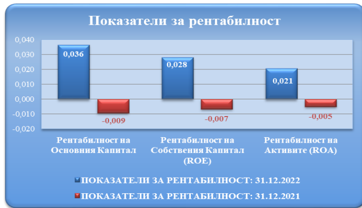
Таблица № 11