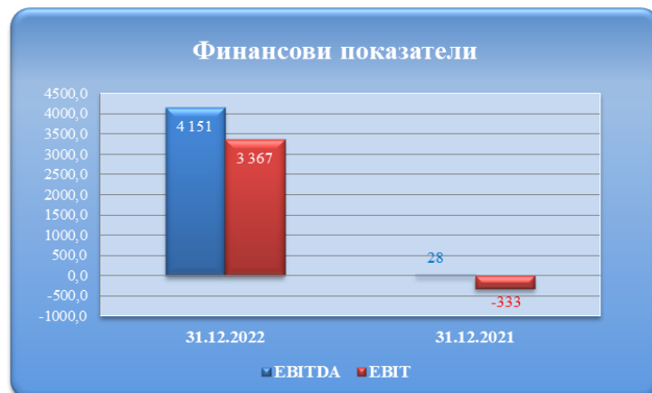
Таблица № 13