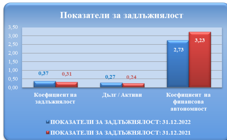
Таблица № 12