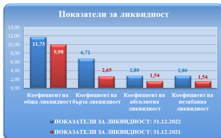
Таблица № 10